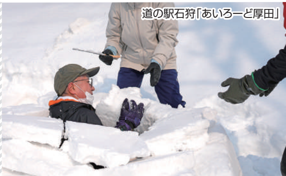
道の駅石狩「あいろーど厚田」

冬季の道の駅の新イベントとして、秀岳荘のスタッフを講師に招き、イヌイットが移動中に建てる雪の簡易住居「イグルー」作りを体験しました。