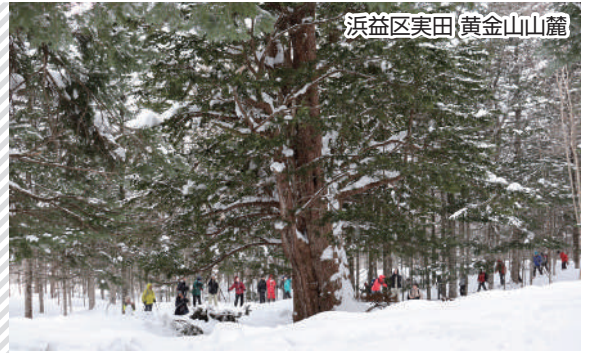
浜益区実田(黄金山山麓)

浜益区民と旅行会社が力を合わせ、手づくり感のあるバスツアーを3年ぶりに開催しました。18人が参加し、感動や感謝の声が寄せられました。