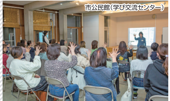
市公民館(学び交流センター)