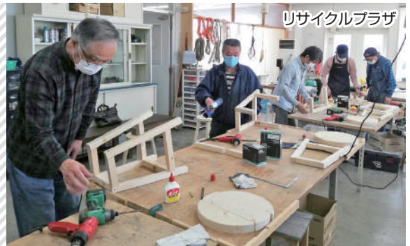
リサイクルプラザ

木材加工会社から譲り受けた廃材で木工製品を作る講座で、循環型社会の形成を目指す取り組みの一つ。リサイクルプラザでは廃材木工講座をはじめ年間32回の講座を開催予定です。