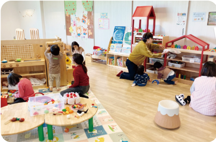
木のぬくもりを感じられる館内は広くてきれい! この日も多くの利用者でにぎわっていました。