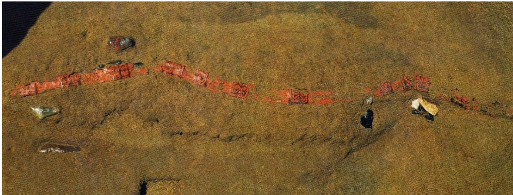
写真1 紅葉山 33 号遺跡 墓壙 (GP-46) から出土した「漆塗り弓 (文様入り)」