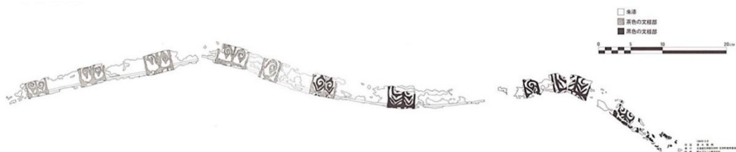
図1 「漆塗り弓」の図