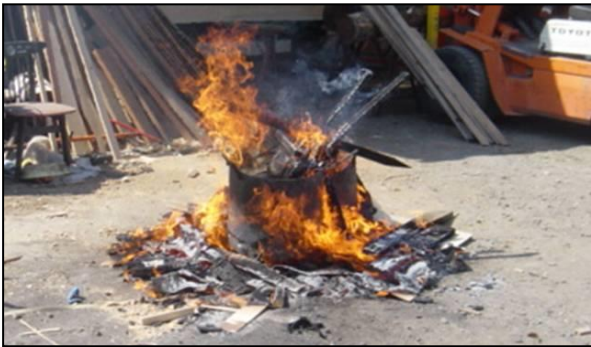
野焼の例・・・このような焼却は違反です！