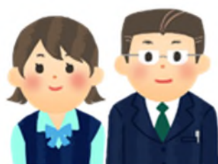
民生委員 社会福祉協議会