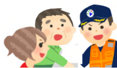
町内会及び自治会

災害時等における避難支援については、避難支援等関係者や地域の支援者による任意の協力として、可能な範囲でお願いするものです。