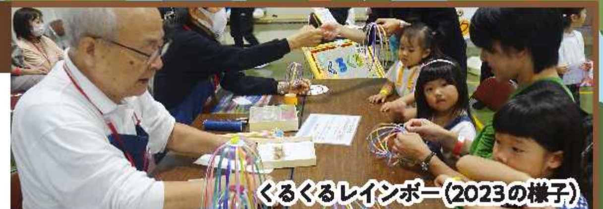
くるくるレインボー(2023の様子)

動かなくなったおもちゃが復活しますよ! 是非おもちゃを持参してくださいね。くるくるレインボーも作成できちゃうよ!