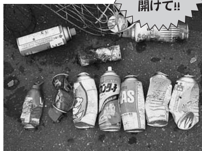
犯人はスプレー缶! 必ず穴を開けて!!