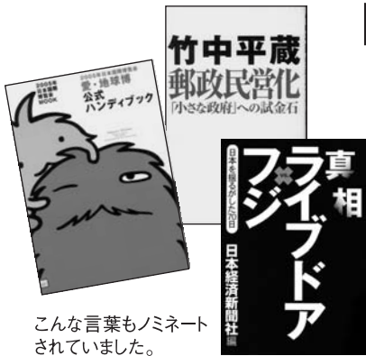
こんな言葉もノミネートされていました。

そり借りて、気持ちよく年を越しましょう! テーマ 「2005年・流行語」 日にち 12月13日(火)～29日(木) 場所 本館特集コーナー