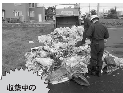
収集中のパッカー車から火災発生!