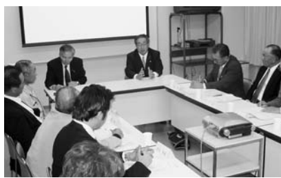
▲浜益区地域協議会