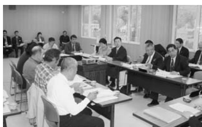
▲厚田区地域協議会