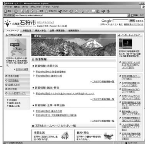
リニューアルした石狩市のホームページ

●広報紙への感想や批評、市への質問など何でもお寄せください。 ※匿名希望の場合もお便りには名前・住所・電話番号を必ず明記してください。 〒061-3292 石狩市役所 広報いしかり 係 ☎72-3153 ☎74-5581 ✉PR@city.ishikari.hokkaido.jp