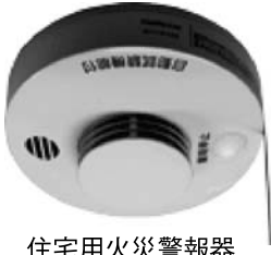
住宅用火災警報器