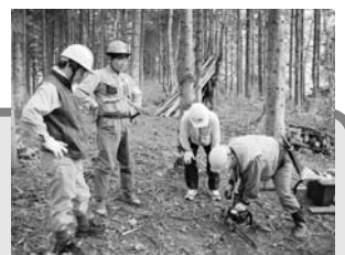
昨年、「21世紀の森」で行われた「ふるさと学習」の様子