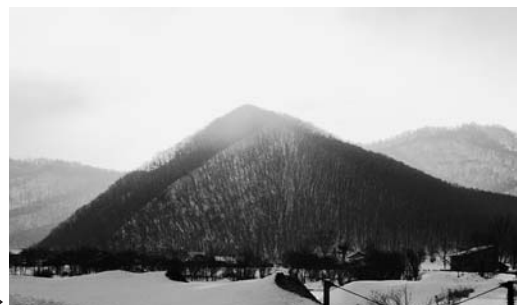
春分の摺鉢山の日の出▶