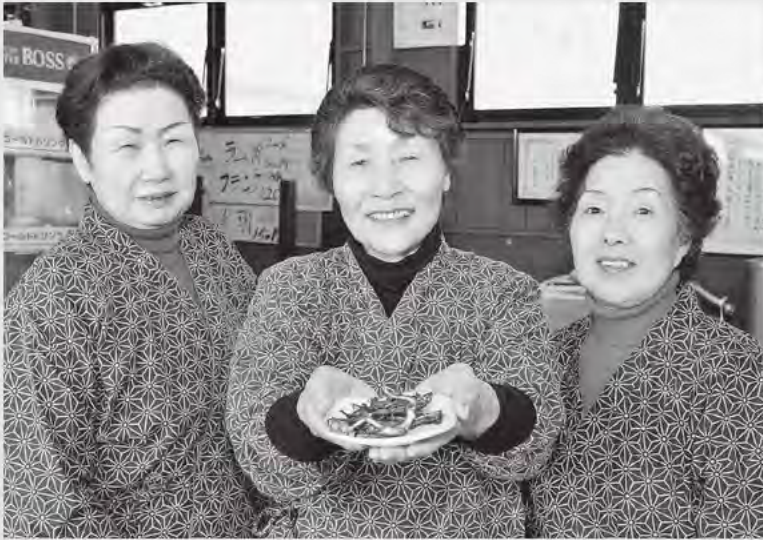
▲「広報みたよ」で、ワカサギの佃煮が試食できます!

この魅力は、なんといっても地元の旬の美味しいものが並ぶところ。4月はホッキ貝やタコ、カレイ、ヒラメが要チェックです!