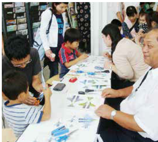
▲昨年の様子(ホチキスのヒコキを飛ばそう!)