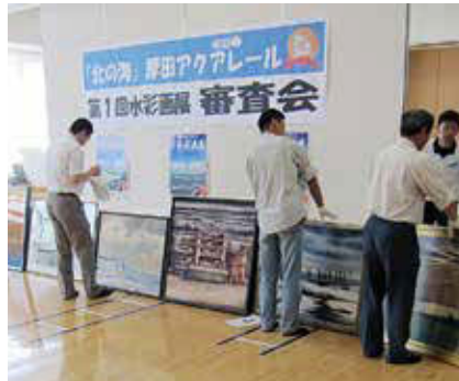
▲第1回審査会の様子

豊かな四季と風景・風物・風土、そこに住む人々の暮らしや未来に残したい光景などをテーマにした水彩画コンテストです。 応募資格 国内在住の18歳以上の方(高校生は除く) ※プロ、アマチュア、国籍は不問 作品規格 ①本人制作の水彩画(混合技法も可) ②未発表の作品 ③サイズはS30号(910mm×910mm)以内、厚みは50mm以内 ④作品保護のため、額装※ガラスは不可、アクリルは可。1人2点まで 費用 出品料1点3,000円 申込方法 所定の申込書(市HP http://www.city.ishikari.hokkaido.jp/citizen/life/a-chiikis05013.html から入手可)を提出 申込期限 H26/6/30(月) 申込・問合せ 厚田アクアレール実行委員会事務局(厚田支所地域振興課内) ☎78-2012