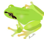
ニホンアマガエル

＊この『いしかりカエル便り』では、石狩市が実施している外来種のカエルに対する取り組みや活動、石狩市内の外来種のカエルについて取り上げ、何号かにわたって紹介します。